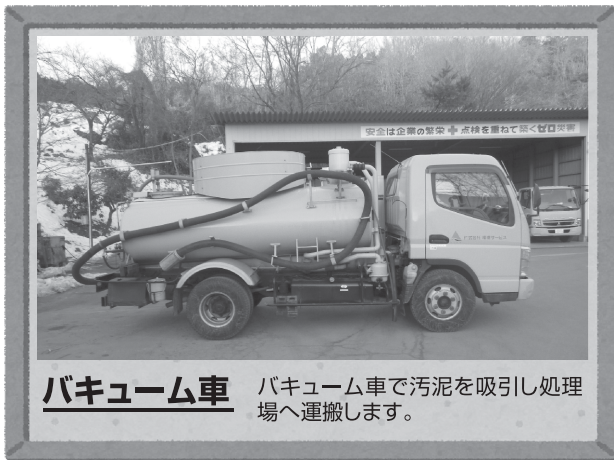
バキューム車 バキューム車で汚泥を吸引し処理場へ運搬します。