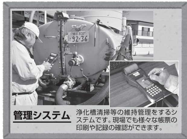
管理システム 浄化槽清掃等の維持管理をするシステムです。現場でも様々な帳票の印刷や記録の確認ができます。