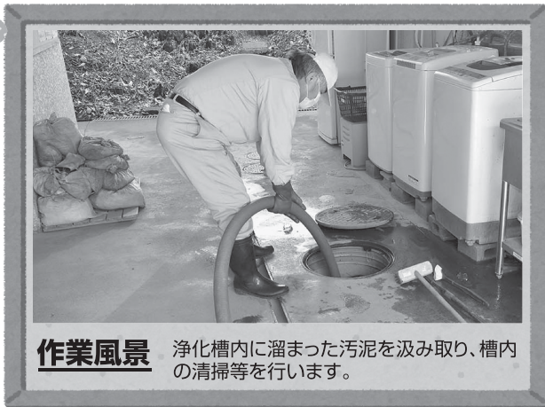
作業風景 浄化槽内に溜まった汚泥を汲み取り、槽内の清掃等を行います。

(※(株)環境サービスは小川町の許可業者、グループ会社の小川清掃(株)は小川町・ときがわ町・東秩父の許可業者です。)